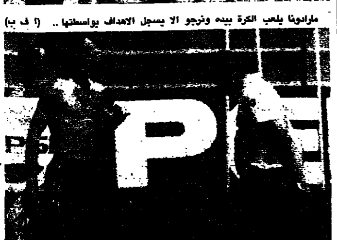
البرازيليين يلعبون بدمعته مع مديهم لازاروتشي